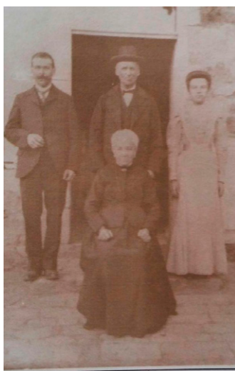
Mes grands-parents et arrière-grands-parents