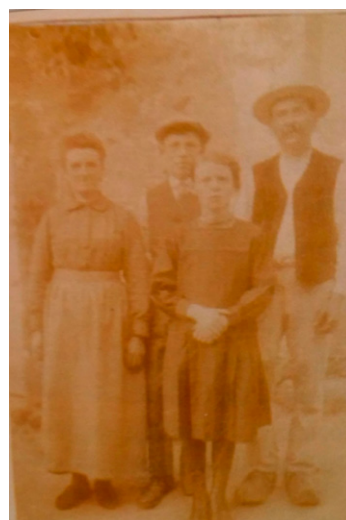
Mes grands-parents et leurs enfants