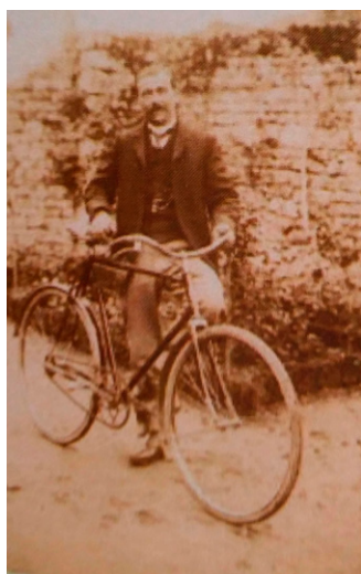
Mon grand-père à bicyclette

Mon grand-père, particulièrement, par sa manière d'être, simplement sans le dire, a été un exemple de droiture et d'intelligence.