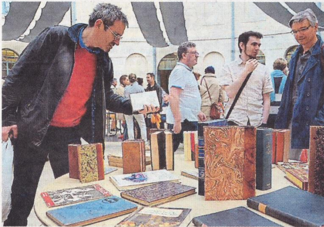
Des libraires, des associations culturelles, des relieurs, des calligraphes... exposent aussi au salon du livre.

Et de vingt salons ! Pour ce 20 e rendez-vous, les auteurs sont en dédicace ou en interview encore aujourd'hui à la Halle au blé d'Alençon.